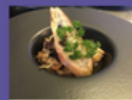
LA TAILLE ROUGE