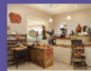
RESTAURANT AUBERGE SOLOGNOTE LE VIEUX FUSIL