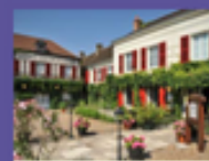
AUBERGE DE L'ÉCOLE