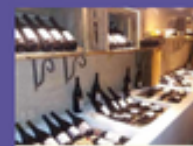
LE CUL DORÉ